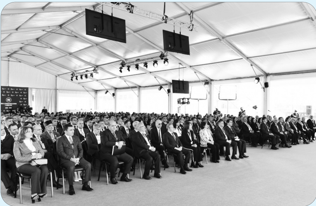
əvvəli səhifə 1-də

“Dövlətimizin başçısı cənab İlham Əliyev Qurultayda söylədiyi geniş nitqində, demək olar ki, xalqımızın həmrəyliyinə və sarsılmaz birliyinə, bizi qələbəyə aparan yola, 44 günlük Vətən müharibəsində zabit və əsgərlərimizin keçdiyi döyüş yoluna nəzər saldı, post-